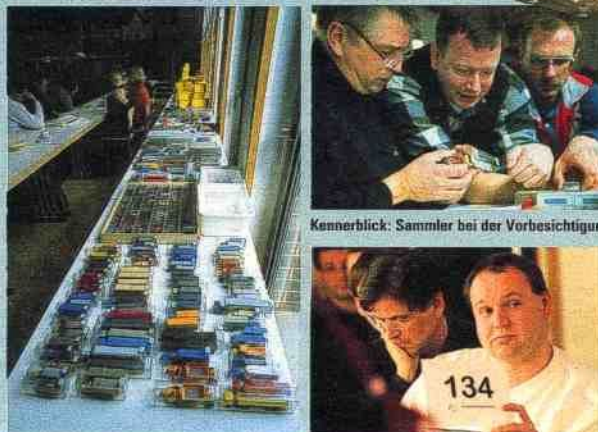
Konvoi: Wiking-Modelle für über 100 000 Euro Konzentration: die Karte zum Bieten bereit

noch erhalten sind. „Früher haben die Kinder mit den Autos tatsächlich gespielt“, sagt Saure, „deshalb ist der Großteil kaputt.“ „Stark bespielt“ ist tatsächlich ein Fachbegriff für den Ist-Zustand eines Modells.