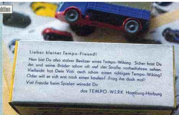
Heiße Welt: Tempo-Werbemodell samt rührendem Packungstext aus den fünfziger Jahren

Das Problem aller Sammler: die maximal zehn Prozent an Modellen zu finden, die heute